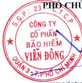
TRƯƠNG NGÔ SEN